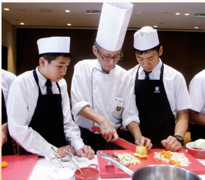
太平洋會 - 學生學習烹調西式食品