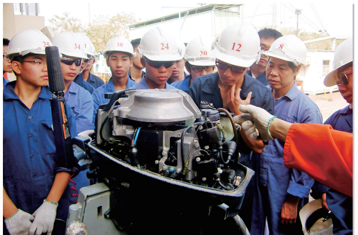
學生於初級全能海員證書課程學習機械知識