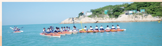
同學到達旅程的其中一站——蒲台島