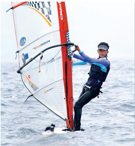
滑浪風帆項目訓練