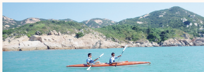
二人之間合作無間，全速前進