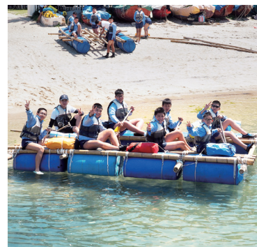
整裝出發，以小組形式前往目的地