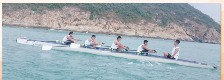
四人划艇校隊練習