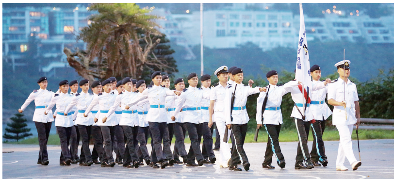
畢業生無懼風雨闊步向前

畢業會操為本校特色活動之一。由於香港航海學校採用「紀律部隊模式」的訓練，故學生的日常生活與步操訓練難以分割。因此，學校每年均會舉辦畢業會操，以紀律部隊畢業的方式歡送畢業生，並讓他們最後一次以香港航海學校學生的身份進行會操。為了以最佳的水平迎接畢業會操的來臨，各應屆畢業生於公開考試後，都加強步操訓練及進行預演，可見他們對畢業會操的重視。