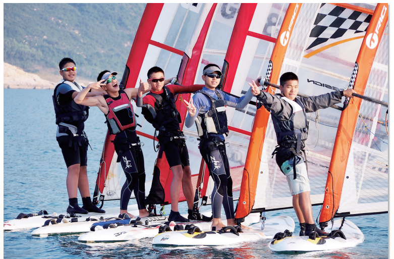
一眾滑浪風帆隊隊員