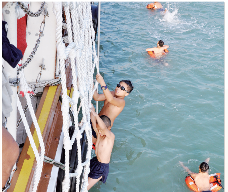
爬繩回船上繼續其他活動