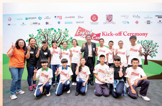
The third team winning the silver medal for the best in team spirit competition