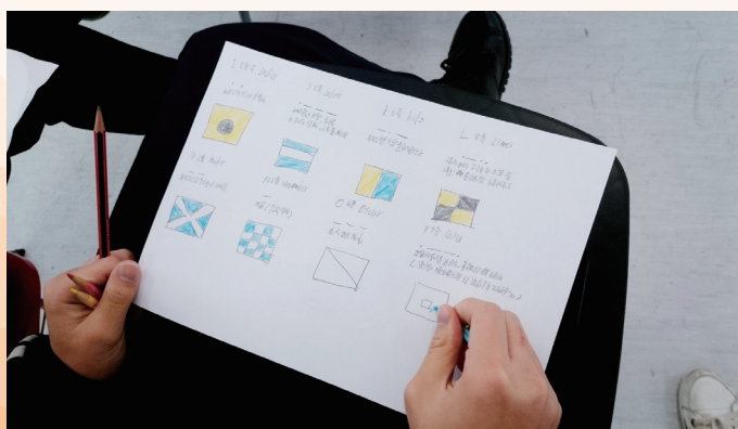
三級遊樂船操作人員證書課程