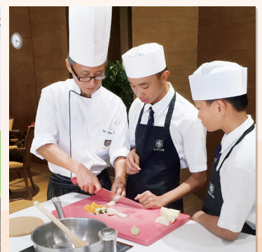
Conversing in English while cooking