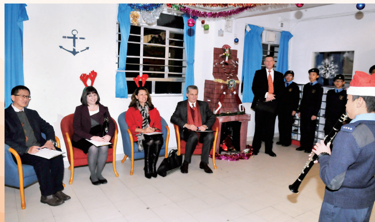
聖誕節學生為來賓表演