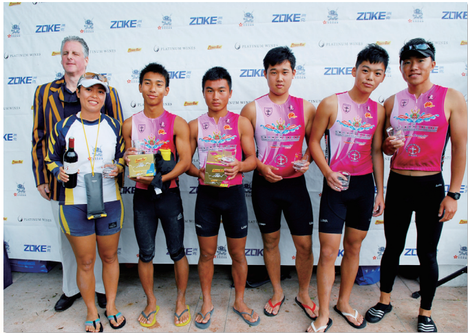
划艇隊於環島賽勇奪殊榮