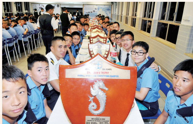
於高桌晚宴展示家社過去一年的成果