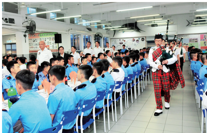
來賓由風笛手帶領進場