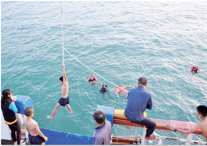
同學們須從船上「跳」下海，勇氣十足