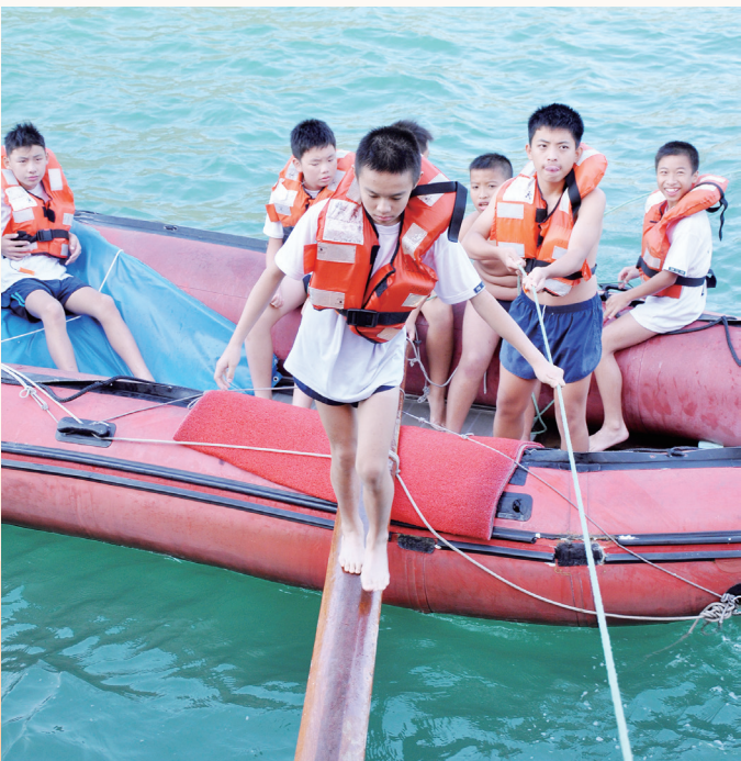
各式各樣的海上歷奇訓練