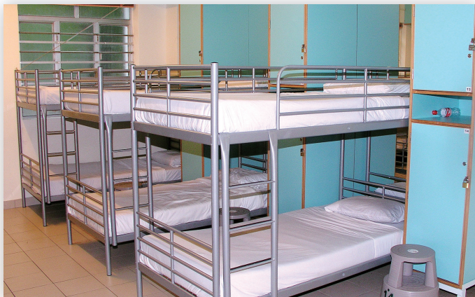
學生床鋪收拾得井然有序