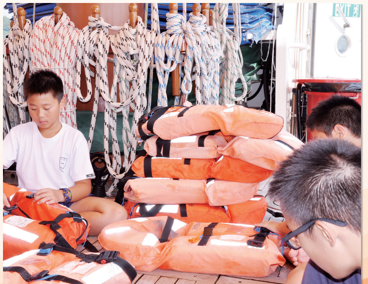
活動完結後，同學整理救生衣