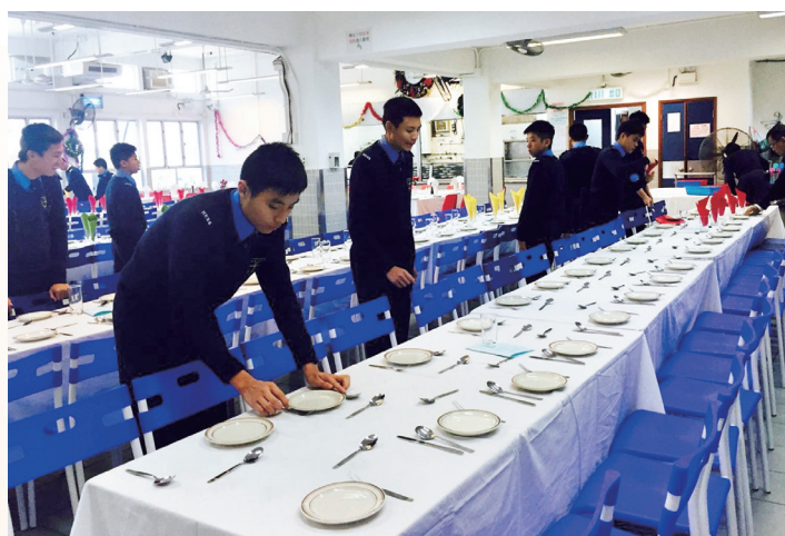
學生為高桌晚宴作準備