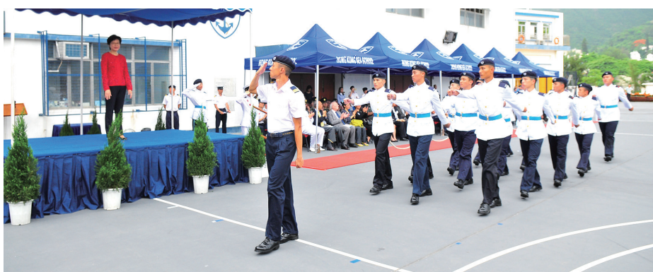
畢業生步操過檢閱台