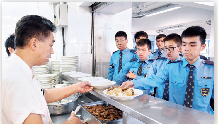
學生排隊領取午餐