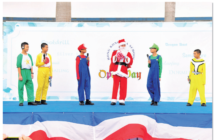
Students performing English drama