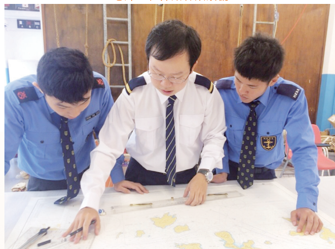
老師教授航海知識