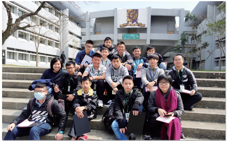
到中文大學參與「紙飛機」活動

中國語文科讓學生在不同學習範疇的個別語文項目，獲取和建構廣闊而穩固的知識基礎，了解本身的興趣和能力，因應志向，為未來進修和就業，發展和反思個人目標。