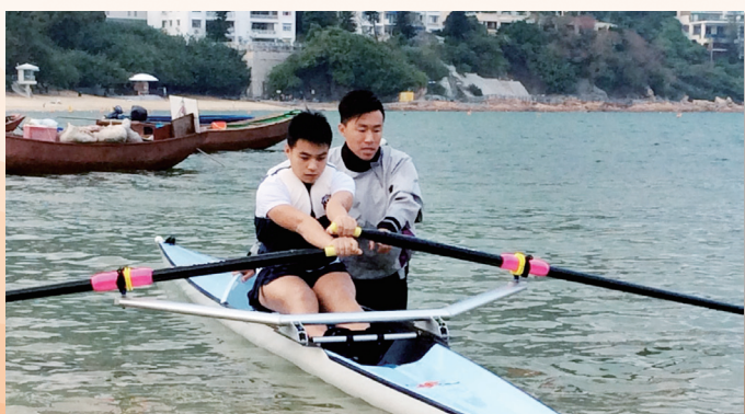
老師正教授划艇動作