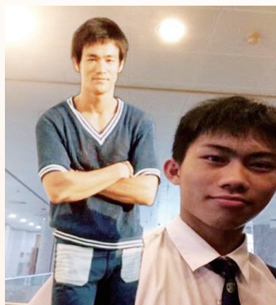
同學可透過科技跟李小龍合照