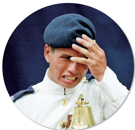
得獎學生心情百感交集