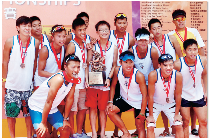
國際龍舟邀請賽贏得錦標