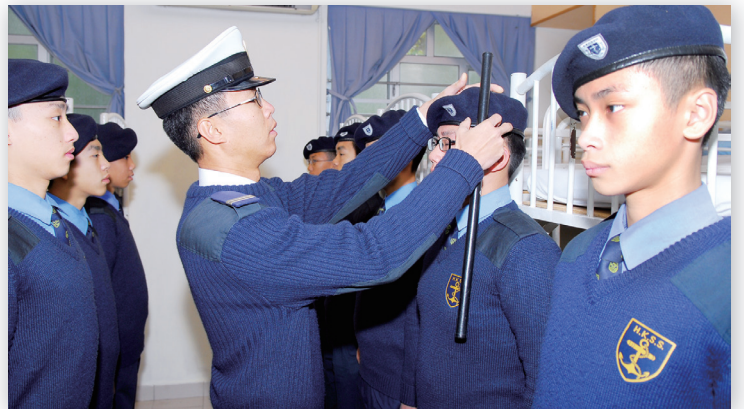
舍監檢查宿舍及制服