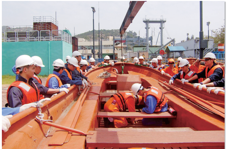
學生們於海事訓練學院上課的情況

為回應本地航運業界的要求，本校積極與海事訓練學院溝通，探討本校學生於就讀高中期間修讀「初級全能海員證書」課程的可能性。「初級全能海員證書」課程乃按照聯合國國際海事組織所訂立的「2010年海員培訓、發證及航行值班標準公約」(STCW 2010)而設，課程內容主要函括甲板及輪機的基礎知識。學生完成課程後可獲海事處簽發海員僱用登記簿，並於商船海員管理處註冊成為正式海員，可以受聘於本地船舶或往來香港澳門的高速客輪擔任見習水手或技工。畢業生可以於工作期間接受培訓，累積足夠工作經驗後，便可以參加海事處不同等級證書考試，發展個人事業。