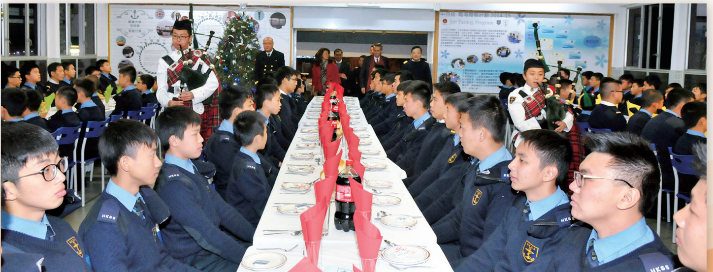
學生正襟危坐等待嘉賓進場