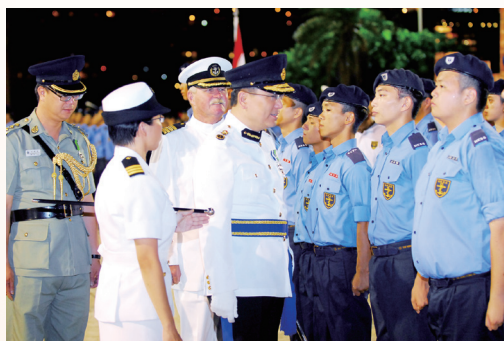
由懲教署署長單日堅先生擔任主禮嘉賓