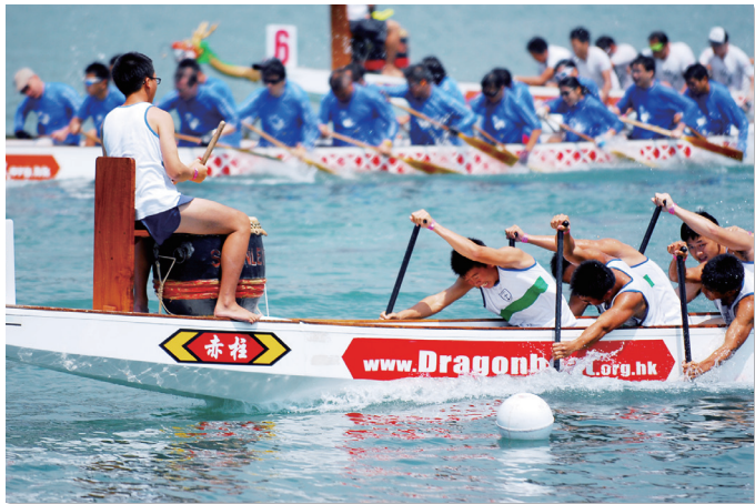
制服團隊龍舟邀請賽