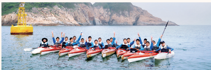
雖然辛苦，但同學都十分投入

中三海上旅程以獨木舟形式進行。三日兩夜的旅程，包括龜背灣、大潭灣、鶴咀海岸公園、經螺洲前往蒲台島進行環島旅程，然後返回學校，全程共30公里。學生於是次旅程中，能夠將本校所學的獨木舟技術，充分發揮，展現學習成果。