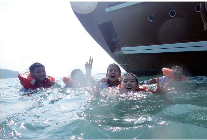
同學都配備安全裝備進行活動