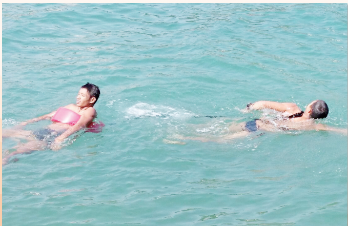
同學正進行海上拯溺訓練