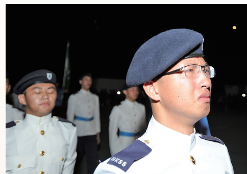
畢業一刻，不禁灑下男兒淚