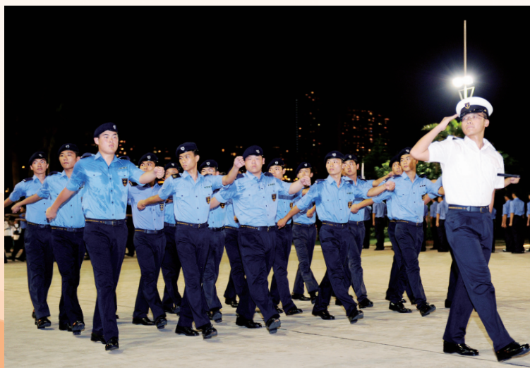
畢業生步操過檢閱台