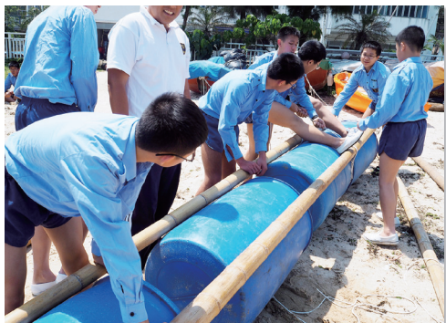
將課堂所學的繩結充分發揮，見證學習成果

中二海上之旅以「竹筏求生訓練」為主題，完成兩日一夜的旅程。學生在首天，完成竹筏後，合力前往土地灣（營地）進行露宿及煮食。翌日，再由營地前往大潭灣，然後折返回校，完成全程共15公里的海上旅程。學生在海事科課程已學到結繩技巧，是次旅程正好作為一個考驗，藉此挑戰學生意志和培養團隊精神。