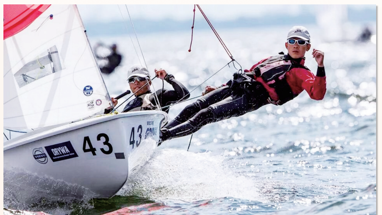
本校其中兩位香港亞運帆船代表