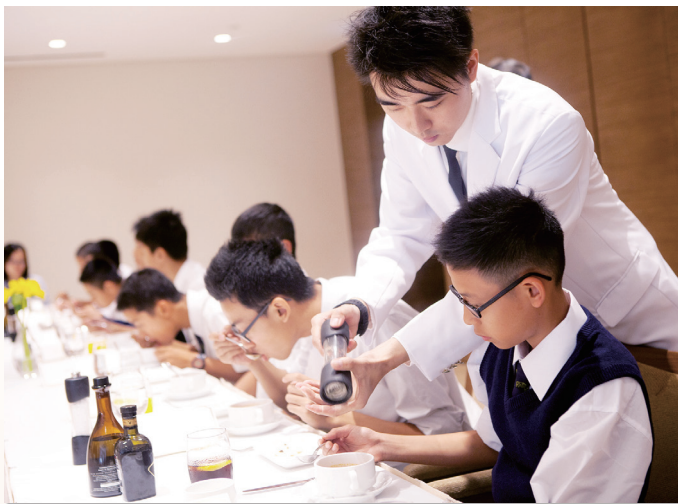
太平洋會 - 學生學習西式餐桌禮儀