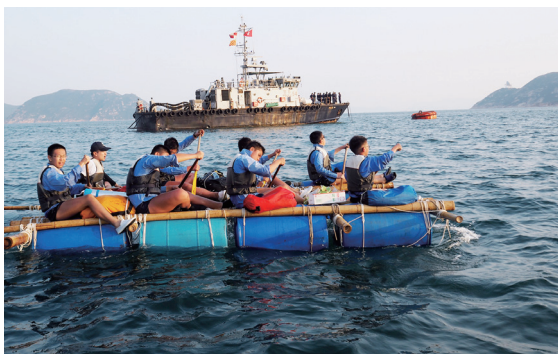
同學努力地扒，望能盡早到達目的地