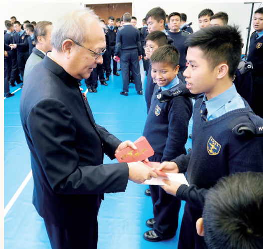
新春活動 - 派利是！