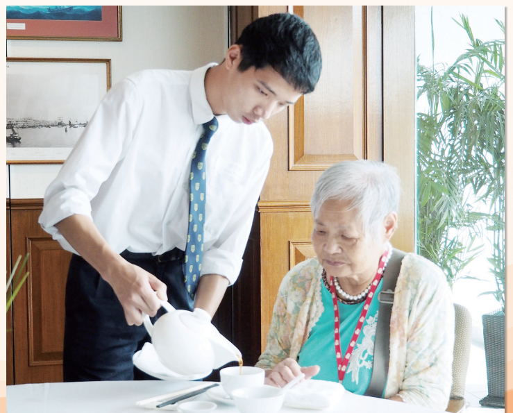
太平洋會 - 學生實習中式餐桌服務技巧