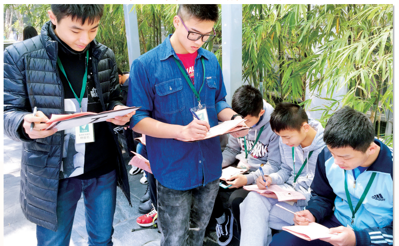
創意寫作班——「紙飛機」