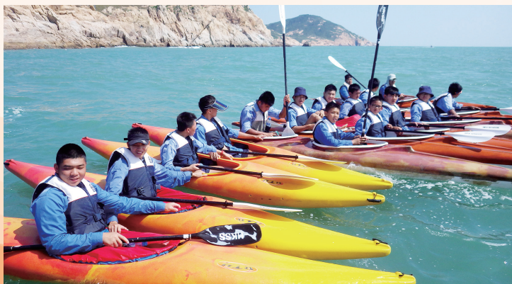
全體中三學生進行獨木舟旅程