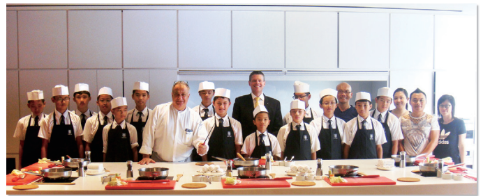
Culinary Training at Pacific Club

On behalf of the school, students also took part in the Valentine Charity Day. They served all the guests and donors, and communicated with them in English on that day. Their performance won appreciation and recognition from everyone present. All the activities have proven that our students are capable of learning the English language, fulfilling the mission of the school and serving the community.