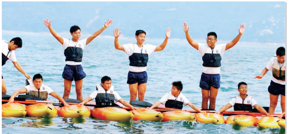
獨木舟訓練時所排列的「艇排」