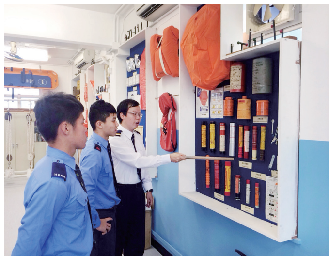
老師正在介紹各類設備

學生完成上述六個範疇後，均可獲得海事訓練學院頒發的訓練合格證書。大部份錄取本校畢業生的公司或機構（例如：本地渡輪服務公司、往來香港及澳門高速客輪公司、遊艇管理公司等）表示，畢業生於離校前已獲得專業資格，可以隨時加入團隊接受培訓，從而縮短培訓時間。而畢業生在培訓過程當中表現積極，備受公司及機構內部培訓導師的讚賞。