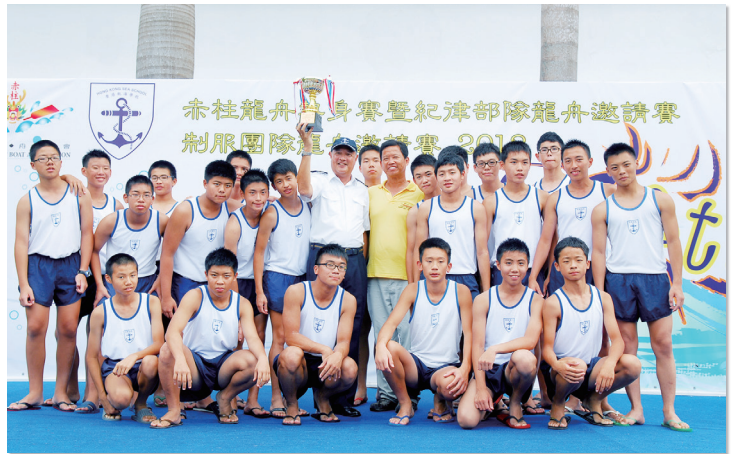
一眾龍舟健兒合力贏得比賽