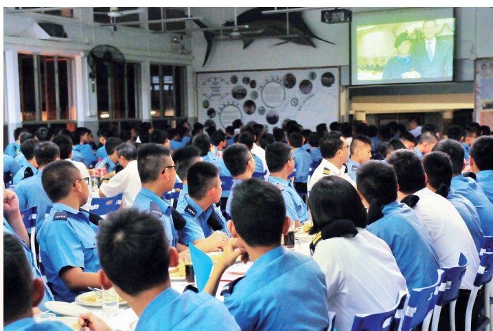
畢業前夕的高桌晚宴，播放應屆畢業生於學校的生活點滴照片