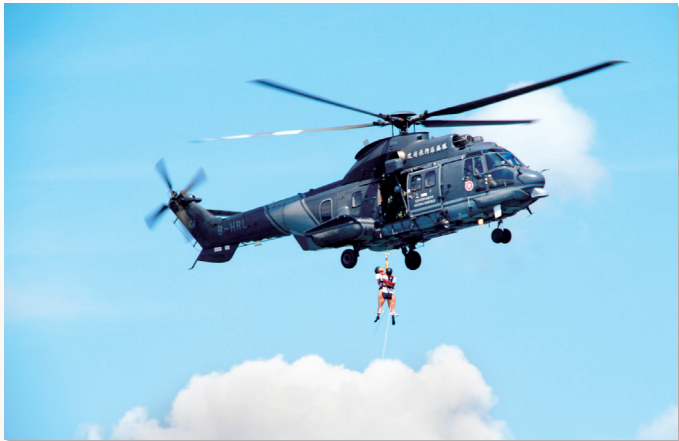
跟政府飛行服務隊進行海上拯救