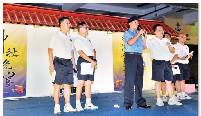
Student took up the duty as English MC