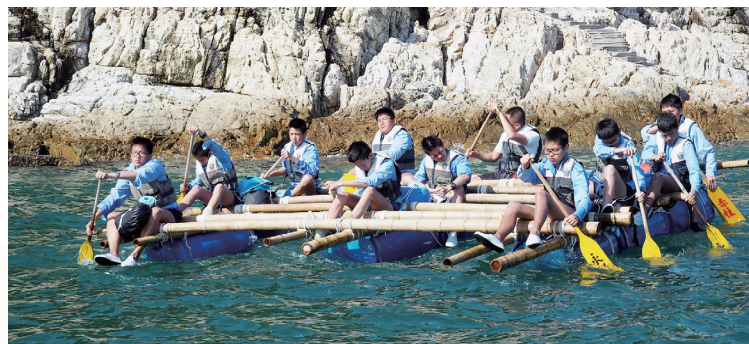
同學們一同努力，向目的地進發