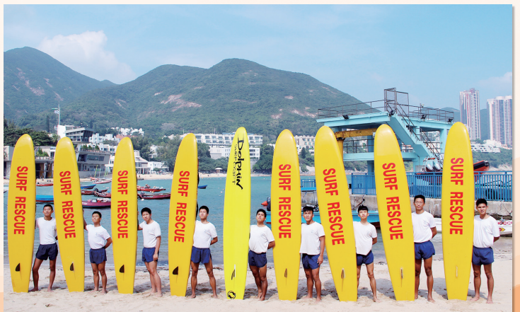
拯溺訓練學員合照

本校是少數香港中學於香港拯溺總會註冊屬會會員，透過參加香港拯溺總會舉辦的訓練課程及考試評核，學生可以考取不同種類證書及專章，從而成為一名專業的救生員。過去多年，本校培訓出不少的學生擔任救生員，為本地水上活動安全人才提供新血。於2015年暑假期間，本校與香港拯溺總會合作舉辦「獨木舟拯救章」、「沙灘救生章」等課程，從而