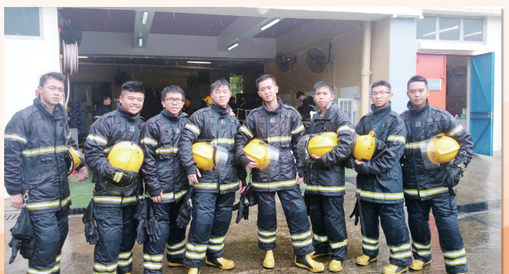
學生們亦需要學習船上消防知識