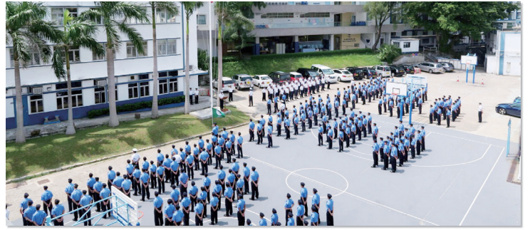
全校師生均需穿著制服

時至今日，雖說從事航海事業的學生人數不及當年，但有紀律的生活模式不單適用於海上，對年青人的成長亦有莫大裨益，因此紀律訓練一直沿用至今，成為學校特色之一。