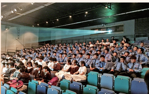
本校同學參與賽馬會藝術計劃