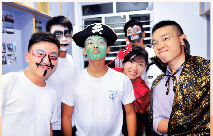
萬聖節學生與英文科老師同樂