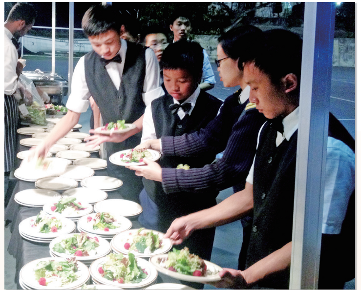
為慈善晚宴作準備