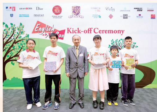
Students winning the Best Performance Award