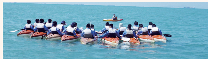
在海中心，團隊精神和服從性都十分重要