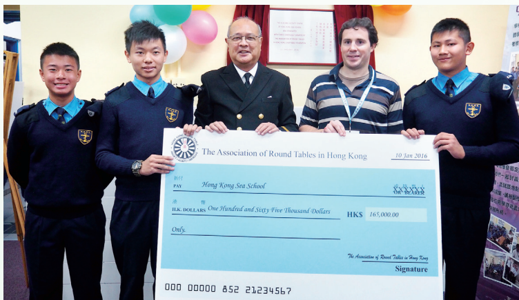
學校於校慶開放日獲香港圓桌會贈送支票作裝修自修室之用