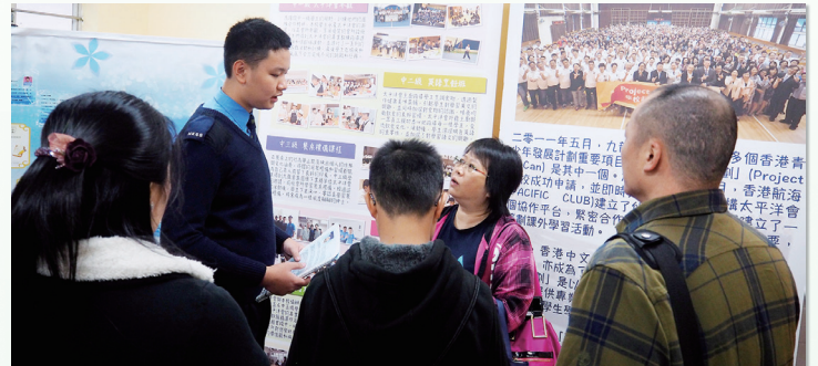
學生在開放日上耐心地向嘉賓講述在校生活情況