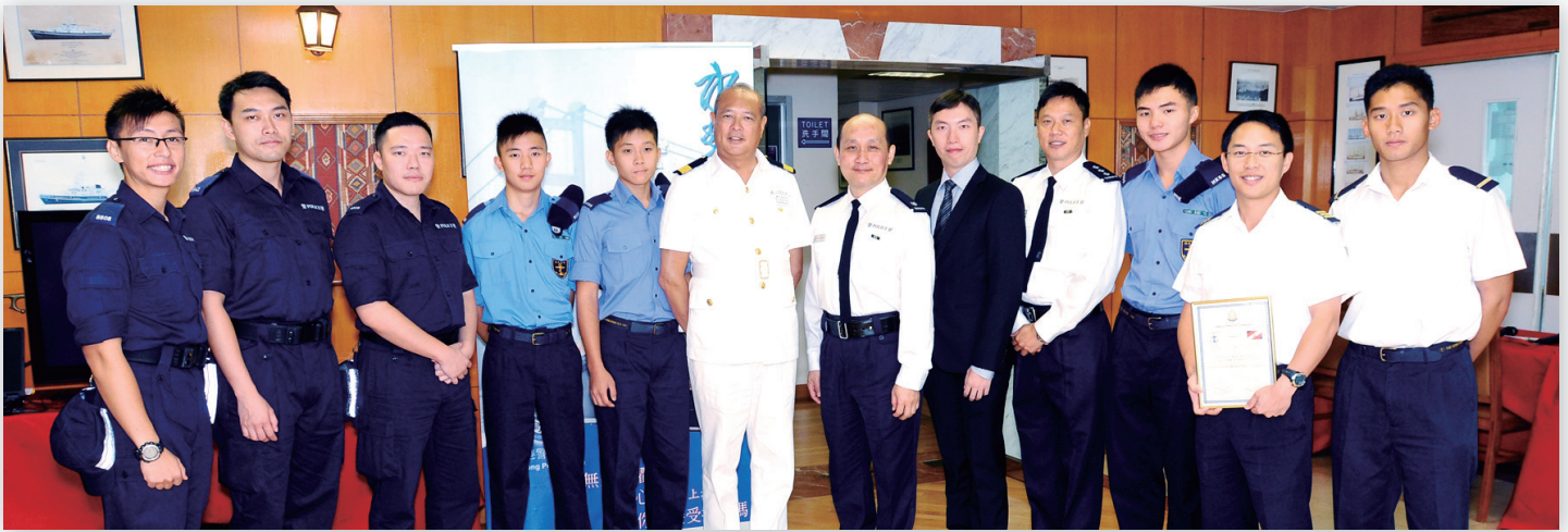
校監、副校長、學長及學員之大合照

水警總區希望透過「水警學長計劃」吸引有志服務社會、對水警工作有興趣的學生及青少年投考警隊。近年，本校亦有幸參加此計劃，部分高年級學生獲邀成為學員。他們在學長及學長助理的適切指導下，訂定目標將來投身警隊，從事水警工作。