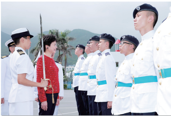
林鄭司長檢閱畢業隊伍