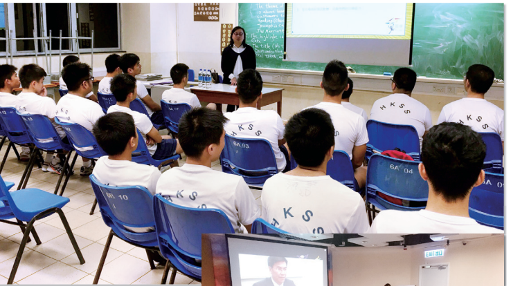
學生參與毅進文憑講座