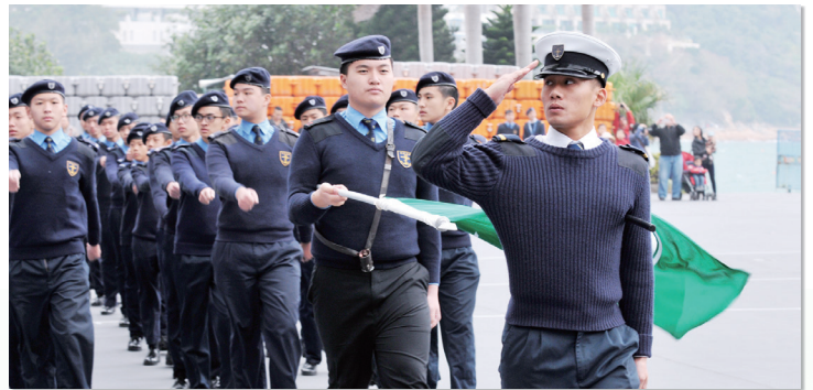
學生在開放日的步操禮上向主禮駕賓敬禮時的英姿