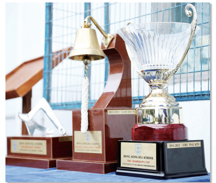
全年表現最佳的三名畢業學生的獎盃