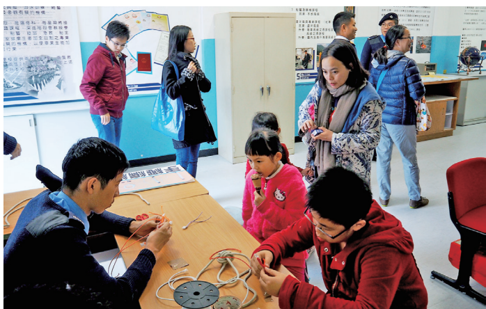
修讀海員科的學生向來賓教授繩結技巧