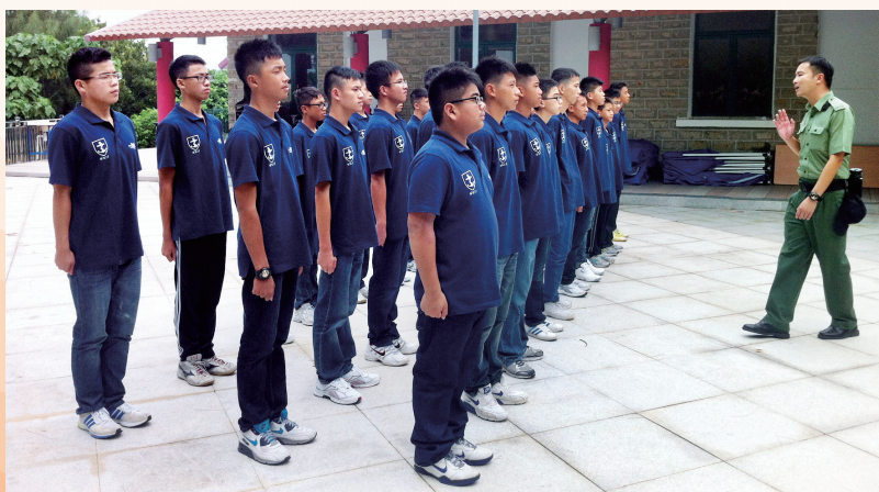
學員們正接受懲教署長官之步操訓練