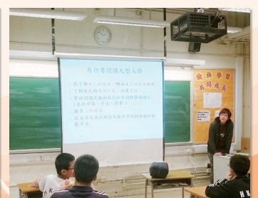
中一學生認識九型人格