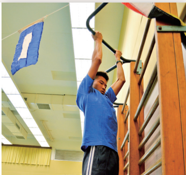
學員為體能測試作操練