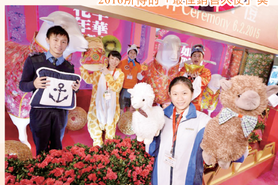
2015年度的主打產品——航海「咕臣」