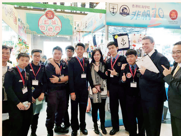
2016年度的「老闆」與太平洋會代表合照留念