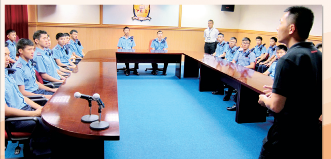
長官為學員介紹懲教署工作概況