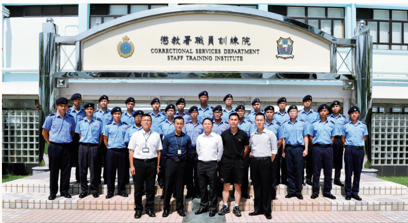
學員們參觀懲教署職員訓練院