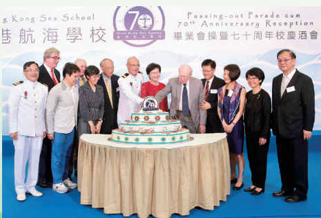
學校副贊助人及校董會成員共慶創校七十年