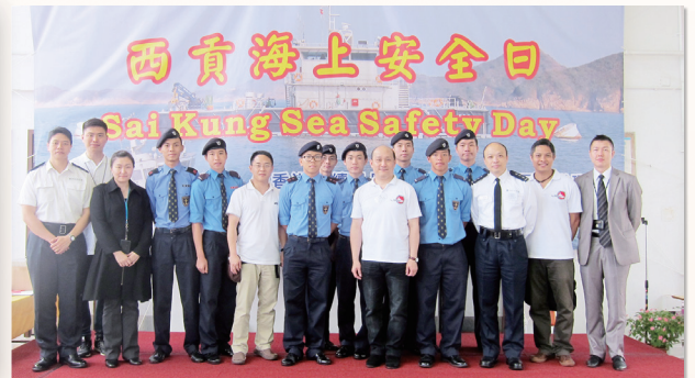
學員參加水警分區主辦的「西貢海上安全日」