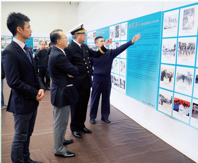
校監在校慶開放日到校支持及緬懷學校歷史