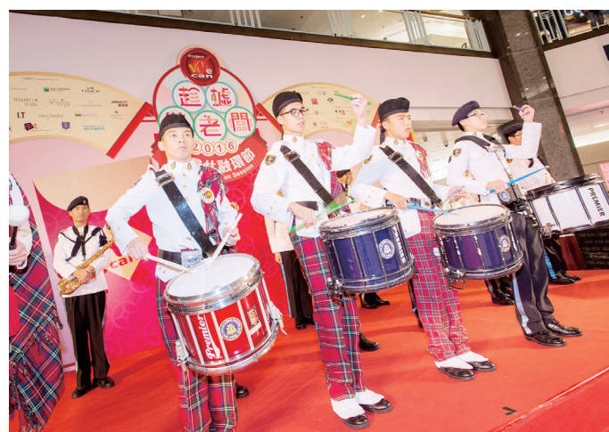
本校步操樂隊獲邀為其中一個表演單位