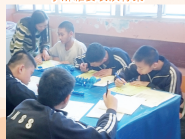
中三學生在填寫「性格透視」問卷