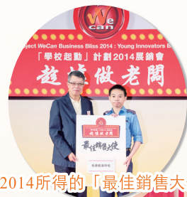
2014所得的「最佳銷售大使」獎