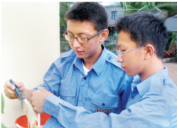
學生為社區會堂油漆