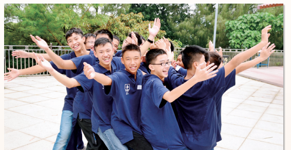
學員們於歷奇訓練中大展身手