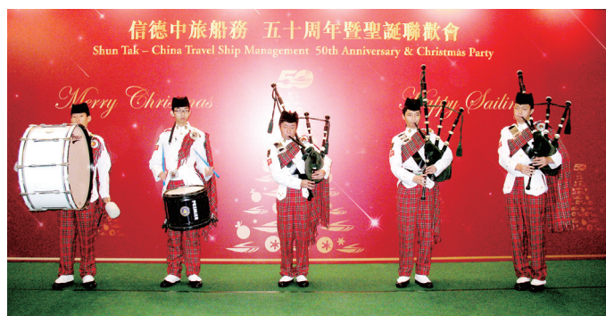
信德船務50周年晚會演出