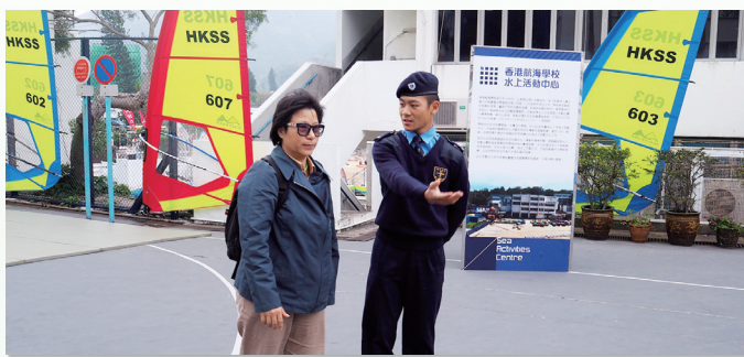
學生向來賓介紹水上活動中心的訓練模式