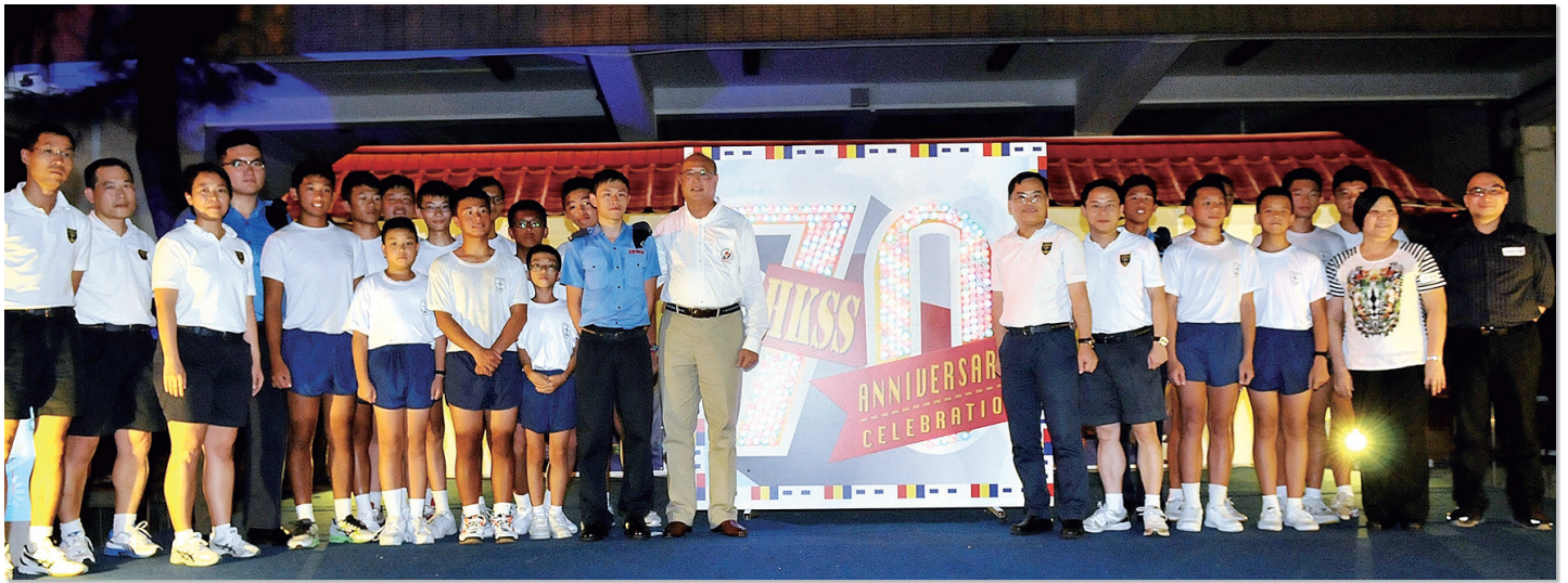
學校在中秋晚會上啟動70周年校慶儀式