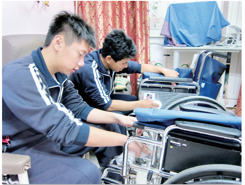
學生在老人院中維修