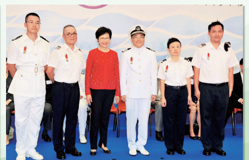
政務司司長頒贈長期服務獎予得獎職員