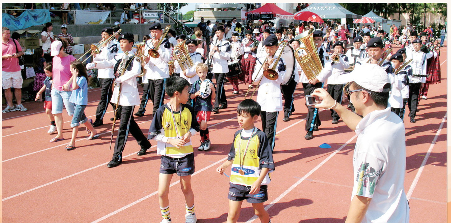
學校銀樂隊在公眾活動中演出