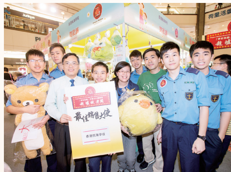
2014年度的「老闆」與校長及太平洋會代表合照