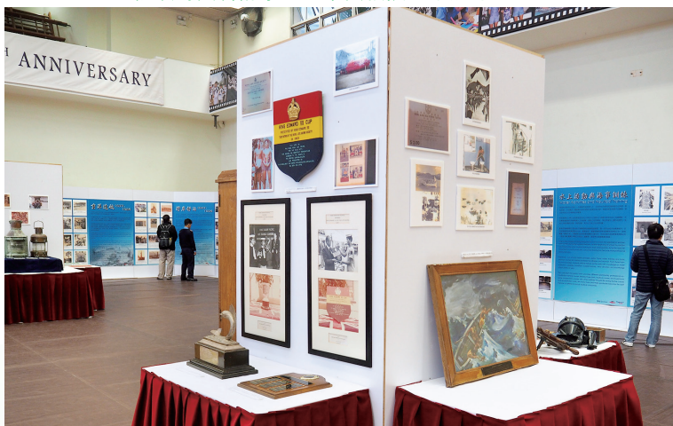
陳舊的獎項印證了學校多年來在水上運動的佳績