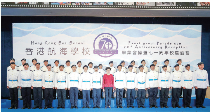
政務司司長林鄭月娥與畢業生合照