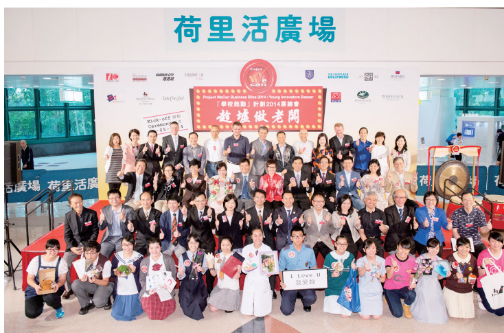
2014年首次參加趁墟做老闆時的大合照

三年來，同學們的努力均獲得各界人士到場支持，因而取得不俗的銷售成績。期望接下來的日子，本校的「老闆」仍然會以他們的努力、創意和誠意，取得大眾的認同和讚賞。