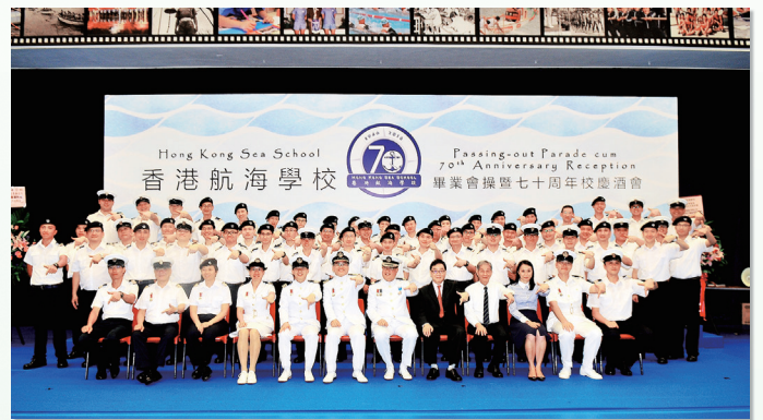
校慶當日全體職員於酒會上合照