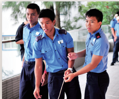
學長與學員於訓練前進行破冰遊戲