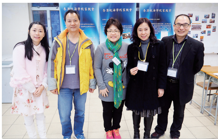
家長們在校慶開放日中協助推廣學校的工作