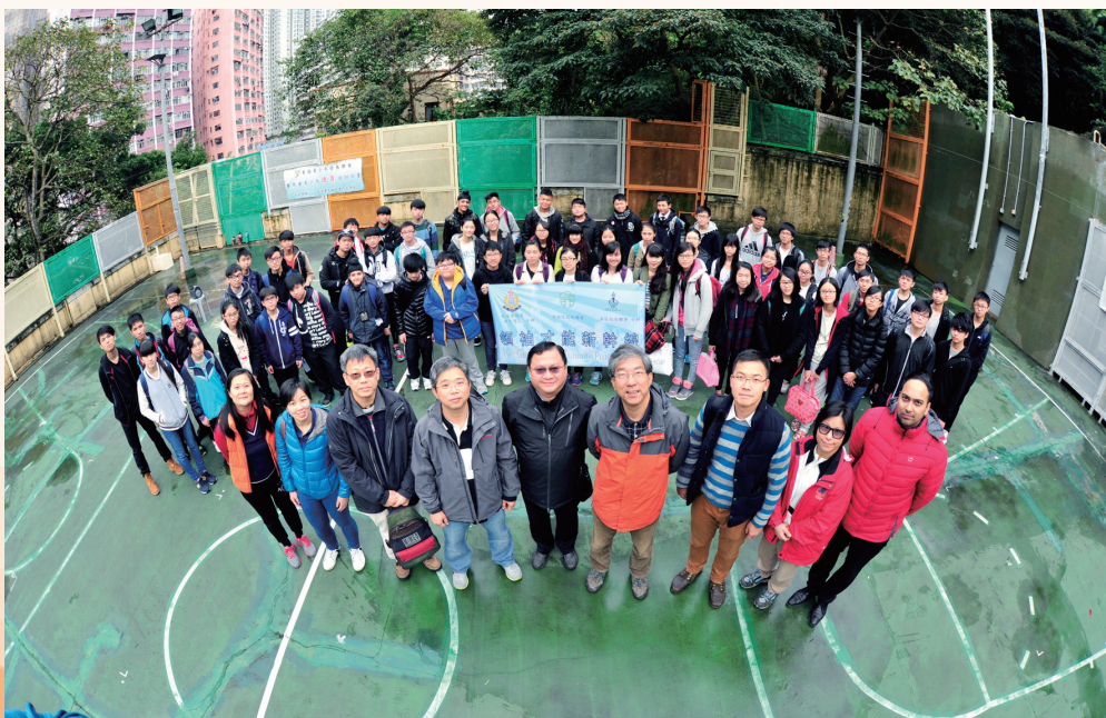
與其他少年警訊分隊出席活動

少年警訊減罪夏令營是少年警訊一年一度的盛事。參加會員透過夏令營舉辦的多項活動，包括講座、競技比賽、時裝設計比賽、歌唱表演、攤位遊戲、博覽及多項體育活動，認識更多的「減罪、抗毒」信息。