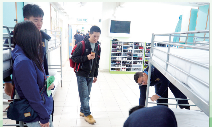
學生展示平日在宿舍中處理床舖的方法