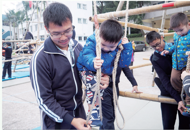
小朋友在導師的協助下感受凌空搖曳的刺激感覺