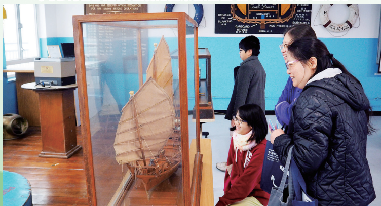
來賓在觀賞海員室內的傳統教學用具