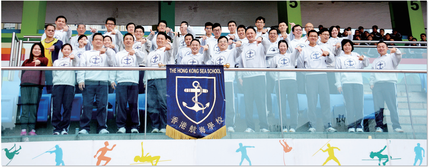
老師們在學校在陸運會上展示代表70周年校慶的手勢