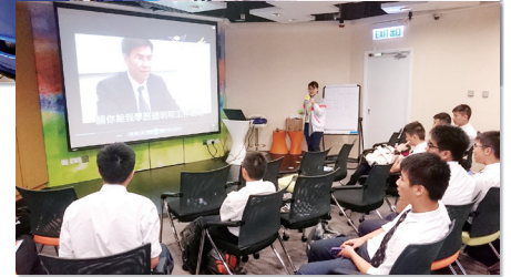
中四學生到青年就業起點參觀