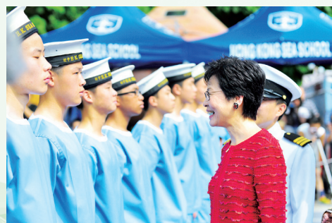
學校60至80年代的制服在畢業會操中再次重現眼前