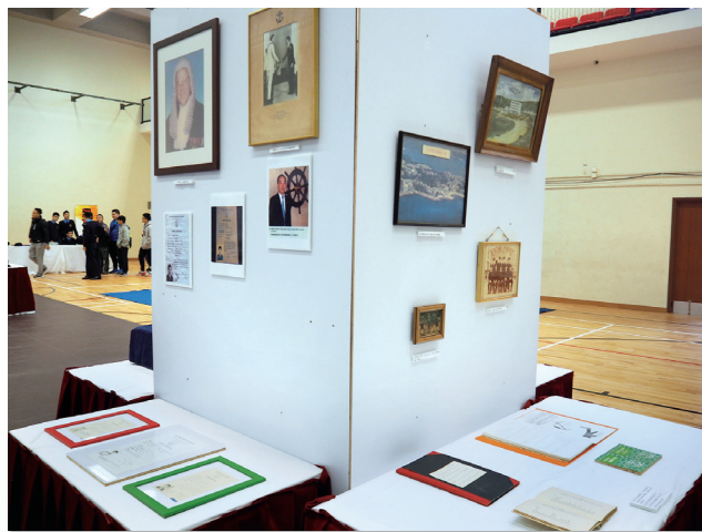
學校在開放日展示了大量昔日的珍貴相片