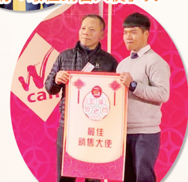
2016所得的「最佳銷售大使」獎