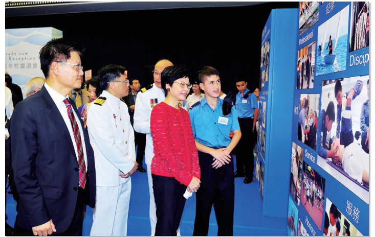
學生向政務司司長介紹學校發展概況

5月28日的畢業會操及校慶酒會，是校慶活動的高潮所在，當日學校榮獲政務司司長林鄭月娥女士蒞臨擔任主禮嘉賓。各畢業生表現出色，中一至中五的同學們則在步操隊伍穿著了不同年代的制服，讓觀眾在觀賞畢業步操禮的同時，了解學校過去不同年代的制服款式。