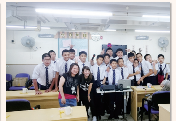
中二學生到探訪老人院及表演