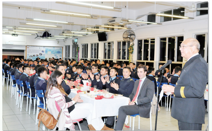
校監在70周年高桌晚宴上致辭