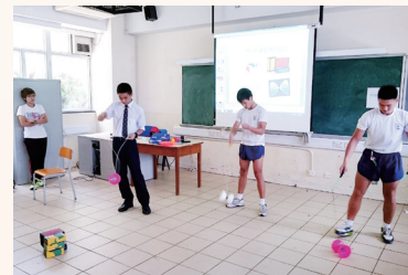
中三學生進行職場體驗，了解雜耍表演行業

生涯規劃組與明愛賽馬會赤柱青少年綜合服務合作，為中一至中三同學舉辦生涯規劃課程。課堂上學生會參與活動，從而更清楚了解自己的特質，幫助學生訂立目標和選科。學生在課堂上積極參與，反應踴躍。學生有助尋找自己志向。