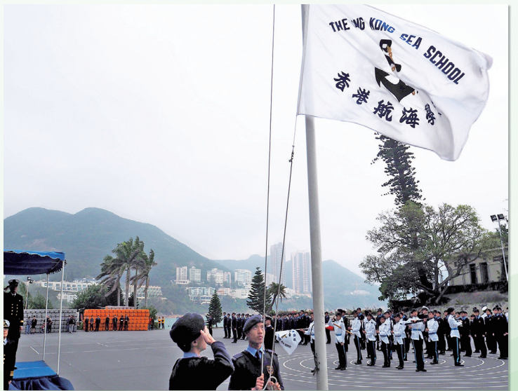
升旗隊和銀樂隊伍在校慶開放日上向外界展示升旗儀式