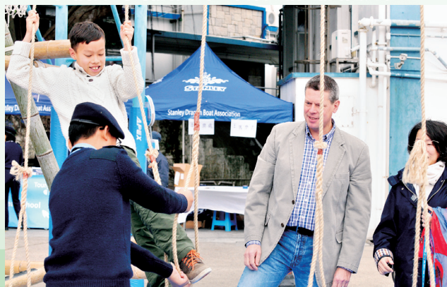
嘉賓們在學生用竹竿及繩結紮的建築物上隨意擺動，考驗同學的繩結功力