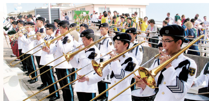
學生為「明德醫院慈善抬轎賽」獻奏