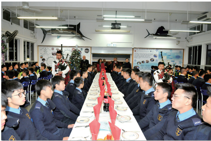
校監、校長及校董會成員在風笛手帶領下參與高桌晚宴時情況