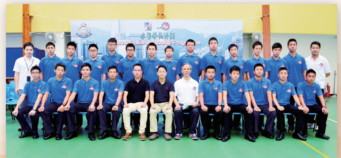
「水警學長計劃資訊日」