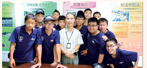
長官為學員介紹懲教署工作概況