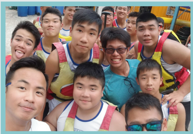
錦標賽獲勝後與師長共慶

過往得到的勝利，是過去的榮耀，勝利者的位置不是永遠屬於我們；過去的手下敗將，不是永遠跟在我們的後面。想繼續爭取第一的位置，就必須付出努力，無論是訓練時間還是比賽時候，我們都應全神貫注，竭盡所能，發揮至最佳狀態。比賽成績正是訓練表現的報告，如何將所教授的技術、比賽時運用的策略，以及臨場的表現發揮，都是我們需要緊記，以便可以爭取出色的表現，以獲取佳績。藉著龍舟訓練比賽，希望同學無論在讀書、運動以至步操等各方面，都應抱著認真的態度，為達成目標而努力。