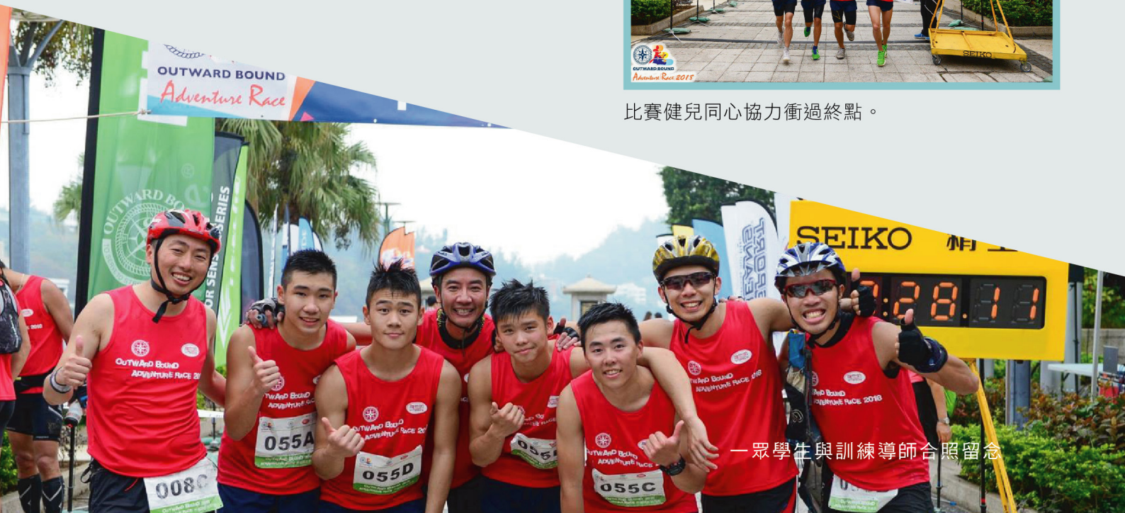
一眾學生與訓練導師合照留念