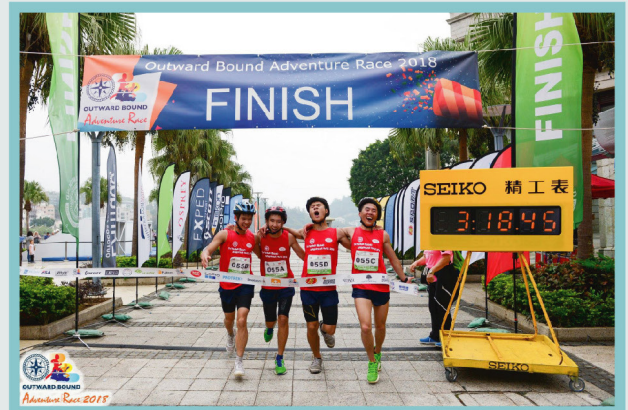
比賽健兒同心協力衝過終點。