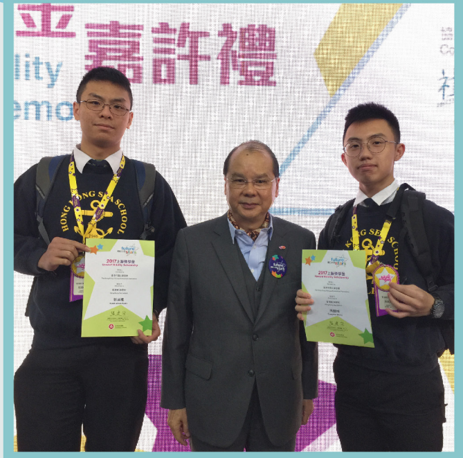
由政務司司長張建宗頒發獎項

整天的學習實在吃力，但是有著老師、家人以及同學的鼓勵，我希望能在香港中學文憑會考中獲取理想成績，以報答支持我的人。