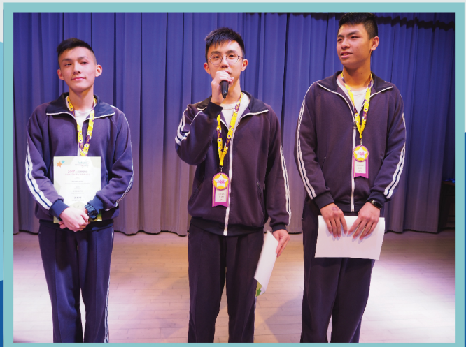
三位得獎同學分享學習心得

學習的道路雖然艱苦，但我深信一分耕耘，一分收穫的道理，在未來的學習道路上，我定必繼續努力以報答協助我的老師及同學。