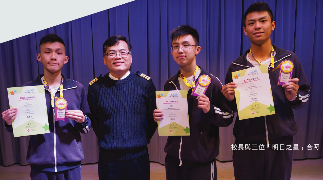
校長與三位「明日之星」合照