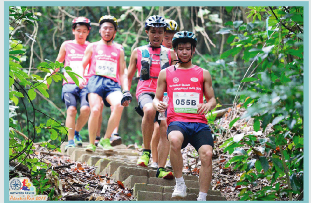
四人同心合力向終點邁進

野外定向除了講求體力訓練外，合作性亦是非常重要。當我們經過香港仔水塘石澗時，我不小心跌倒並扭傷腳踝，因而影響比賽進度，但同伴們不但沒有責備我，更予以我鼓勵支持，令我們最終順利衝過終點。