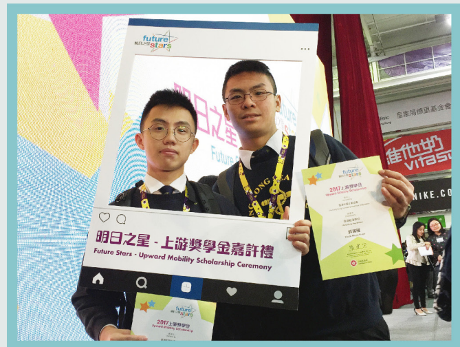
得獎同學在頒獎禮上自拍