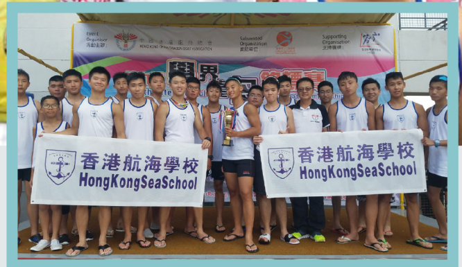
本校共派出二十名健兒參賽